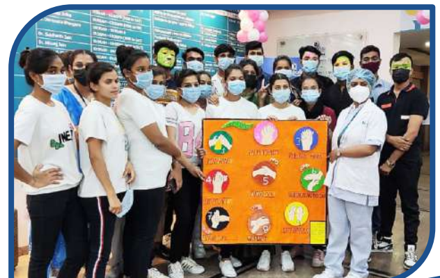
World Health Hygiene Day