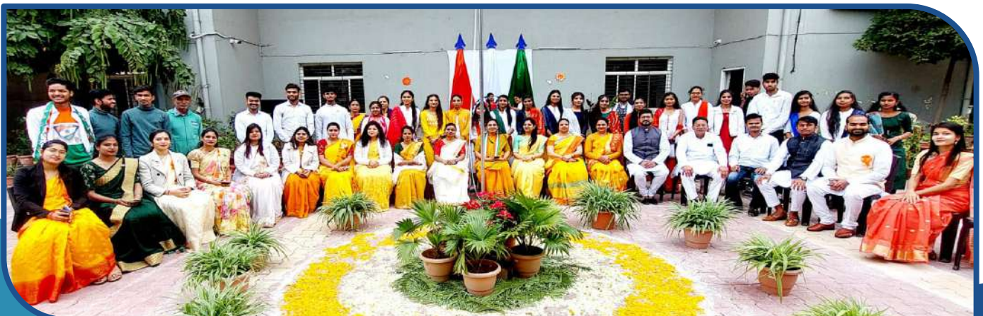
Republic Day Celebration