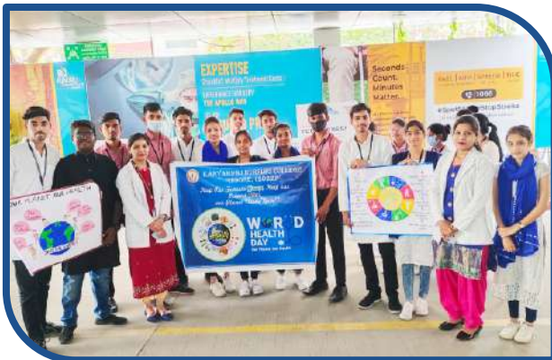
World Health Day