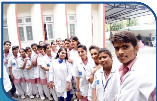
Mental Health Posting