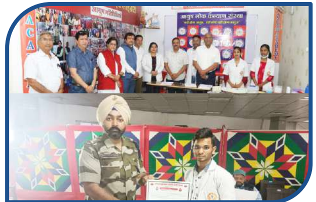
Red Cross Camp