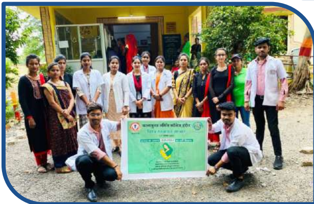
Breast Feeding Week