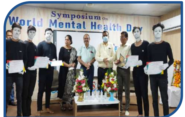
World Mental Health Day