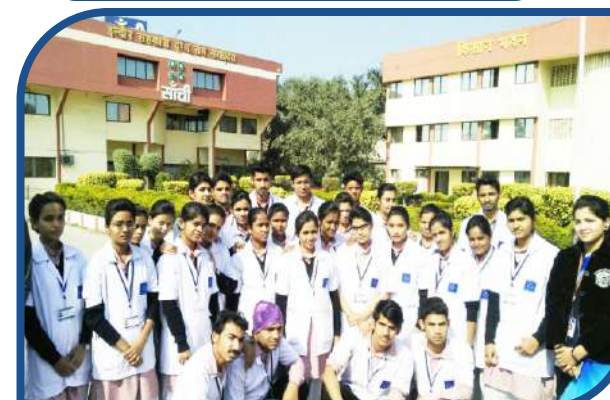
Sanchi Point Visit